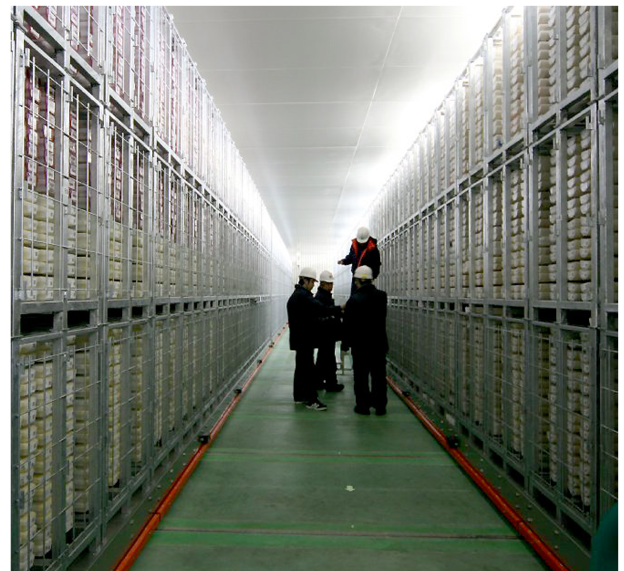
写真：高知コアセンターの様子