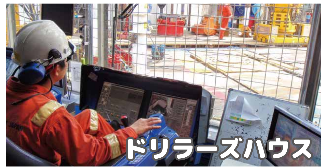
ドリラーズハウス