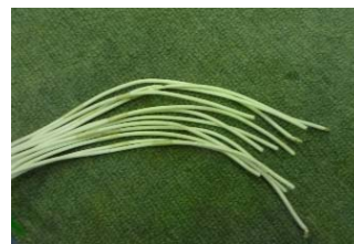
外部側ケーブル先端