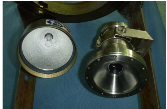
水中ライト・カメラ