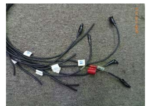
水中側ケーブル先端