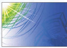
忘れられた海の街 対馬 真鈴 青森県 むつ市立苫生小学校 6年