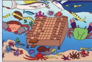
もくずガニのしょうぎ 来生 蛍冬 東京都 八王子市立清水小学校 5年