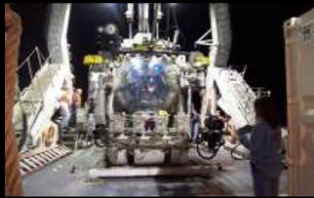
有人潜水調査船による調査. Investigations by the crewed submersibles.