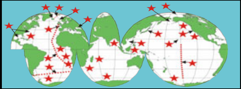
世界に広がる調査地点. Global scale survey sites.

Census of Marine Zooplankton (CMarZ) is one of the Census of Marine Life field projects. Its aim is expanding our knowledge of marine zooplankton biodiversity at the global scale.