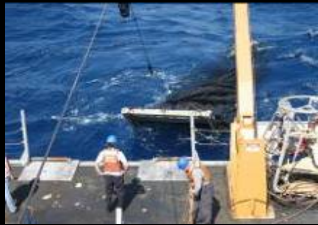
プランクトンネットによる調査. Investigations by the plankton nets.