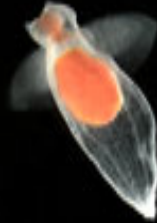
クリオネの1種 Clione sp.