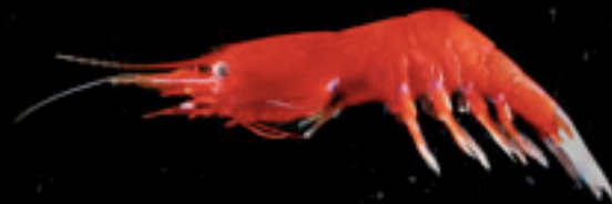
ヒオドシエビ科の1種 Systellapsis debris