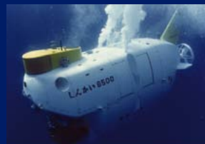
有人潜水調査船「しんかい6500」 人を乗せて世界で一番深くもぐれる潜水船です。