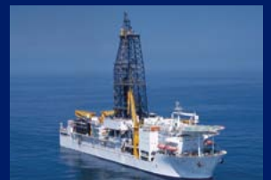
地球深部探査船「ちきゅう」 海の底をドリルで掘って地球の内部を調べる船です。