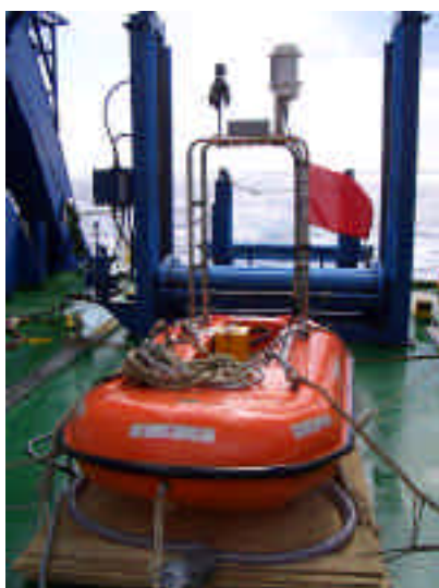
Tail bouy (GPS 付)