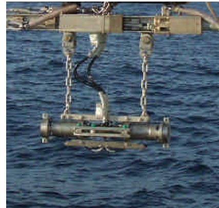
G ガン (写真はリニアクラスター)