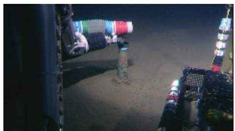
写真 2 深海でのコアサンプリング