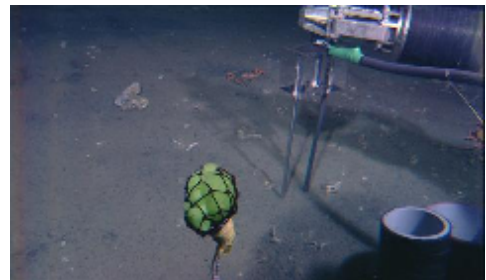
写真 1 深海での TDR 測定

写真 1 に深海における TDR 測定の様子を示した。ROV のアームで TDR プローブを深海堆積物中に挿入し、10 秒間隔で 2 分間測定を行った。その結果、堆積物中の比誘電率 \epsilon が測定地点により異なった ( \epsilon = 48.5 \sim 54.0 )。室内実験で求めた校正式 \theta = 3.71E06 \times \epsilon^3 - 3.60E-04 \times \epsilon^2 + 1.86E-02 \times \epsilon - 5.61E-02 に TDR 法で測定した比誘電率を当てはめ、体積含水率 \theta [ m^3 m^{-3} ] (=液相率 V_w ) を求めた ( V_w = 0.47 \sim 0.57 )。次に写真 2 に深海でのコアサンプリングの様子を示した。採取したコアサンプルから海底堆積物中の固相率 V_s [ m^3 m^{-3} ] を求めた ( V_s = 0.35 \sim 0.48 )。これらの結果を測定点ごとでまとめ、気相率 V_a [ m^3 m^{-3} ] を計算式 V_a = 1 - (V_s + V_w) から求めた ( V_a = 0.01 \sim 0.11 )。以上のことから海底のガスハイドレード含有堆積物中には、多い時で約 10% のガスが存在することがわかった。