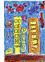
海中都市 村野花良 (むらいあきら) 神奈川県 横浜国立東岡村小学校からめ学級