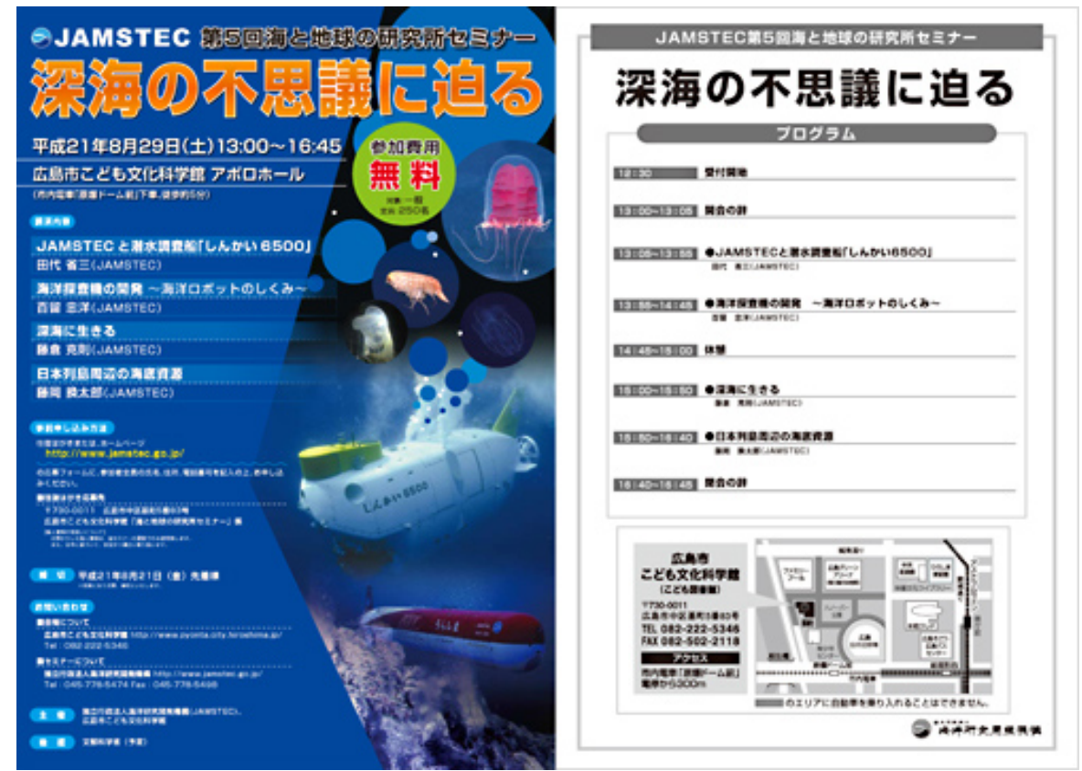
Leaflet (in Japanese)[PDF:436KB]