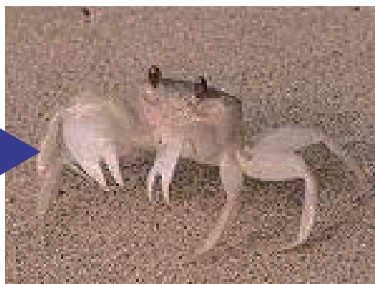
これは「スナガニ」の巣穴です