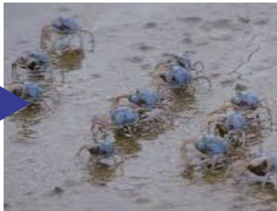
これは「ミナミコメツキガニ」の巣穴です