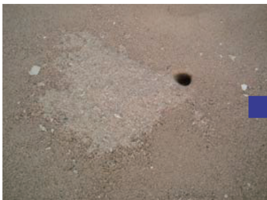
砂をかき出したあとがある!!