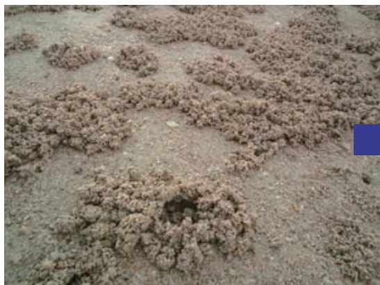
掘り出した砂の塊がいっぱい