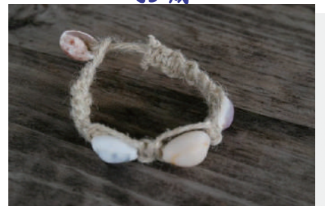
貝がらアクセサリー