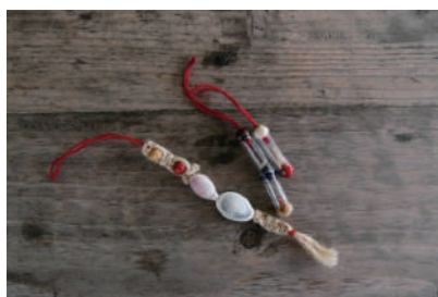
貝がらストラップ