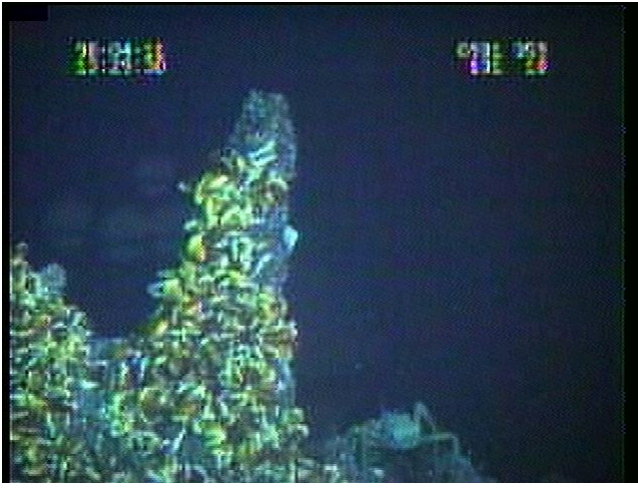
1998.4.11 13:30 水深980m 『しんかい2000』から水中画像伝送による映像 チムニーに群集するシンカイヒバリガイ