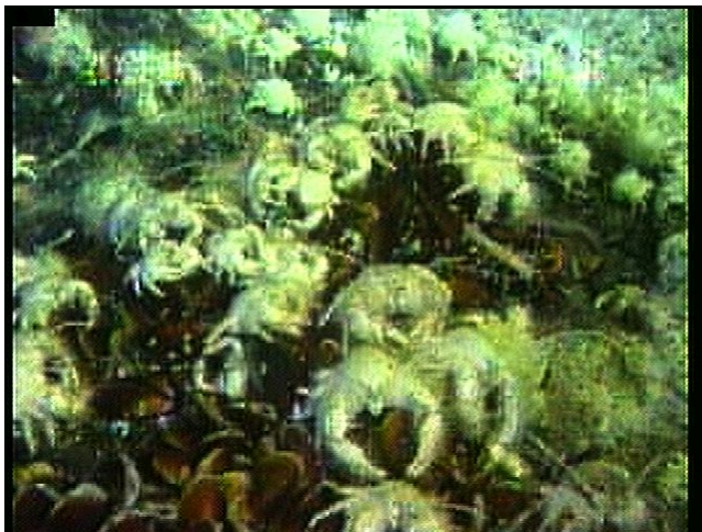
1998.4.11 13:28 水深980m 『しんかい2000』から水中画像伝送による映像 コシオリエビとシンカイヒバリガイ