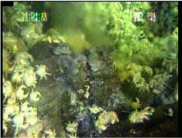
1998.4.11 13:55 水深972m 『しんかい2000』から水中画像伝送による映像 熱水の噴出とコシオリエビ