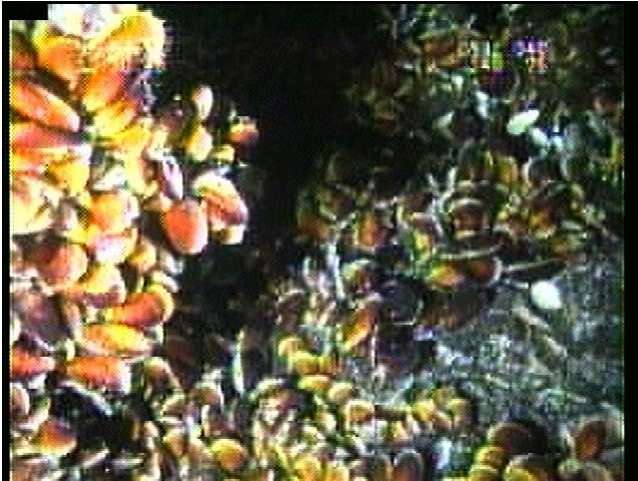
1998.4.11 13:31 水深980m 『しんかい2000』から水中画像伝送による映像 シンカイヒバリガイの群集