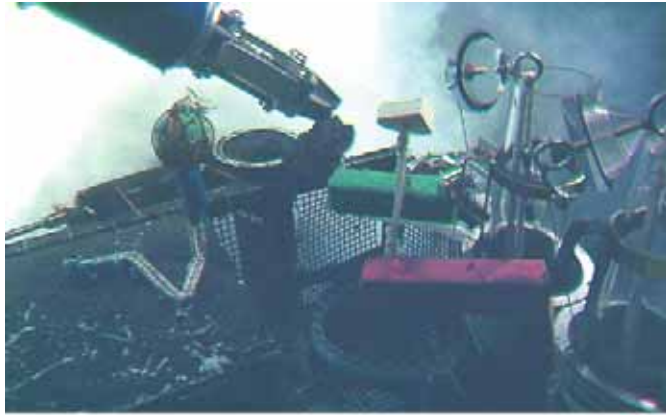
ハイパードルフィンによる試料採取の様子