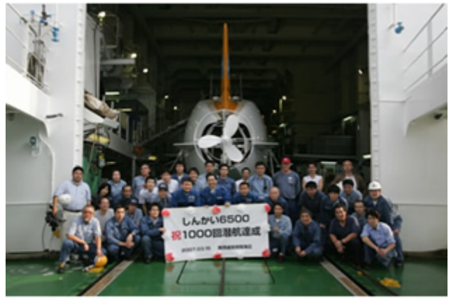
(写真9：参考 関係者一同の集合写真)