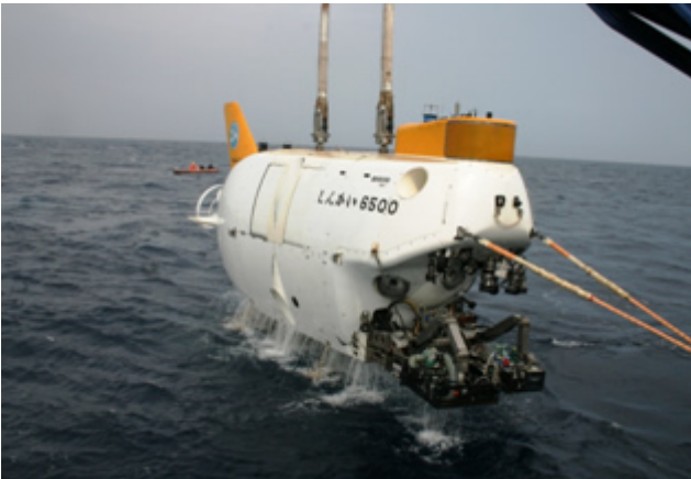
(写真5：船上への揚収作業 1)