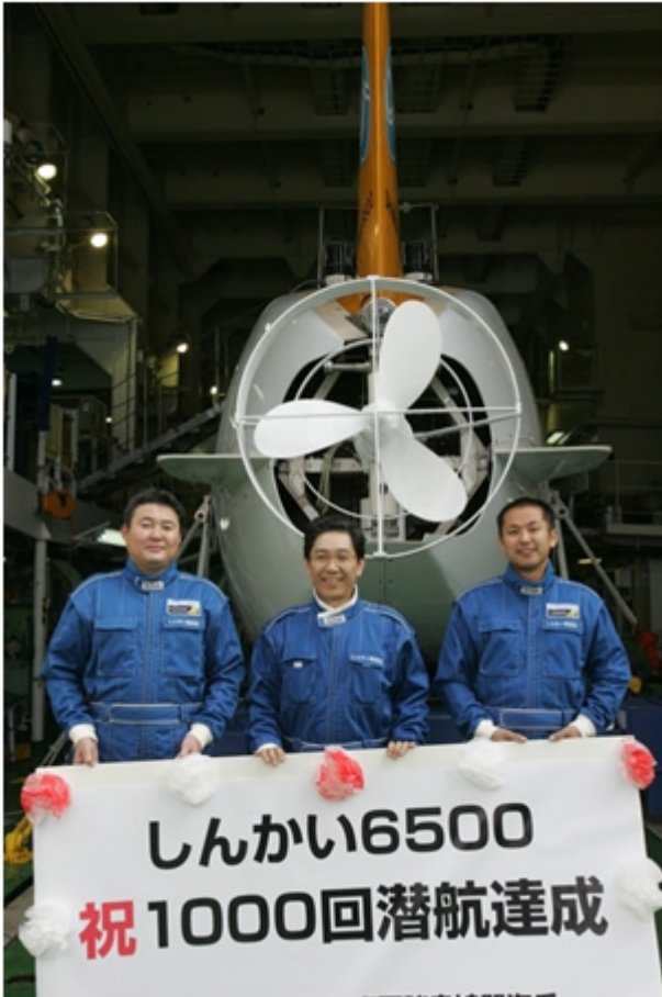
(写真8：参考 「しんかい6500」乗船の3者による集合写真)