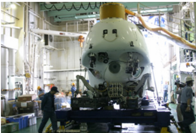
(写真1：船上での潜航前準備作業)