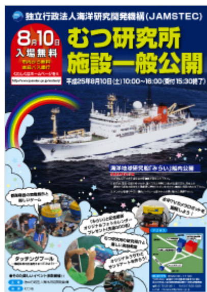
リーフレット[PDF : 610KB]