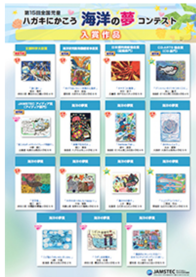
第15回 入賞作品 [PDF : 3.73MB]