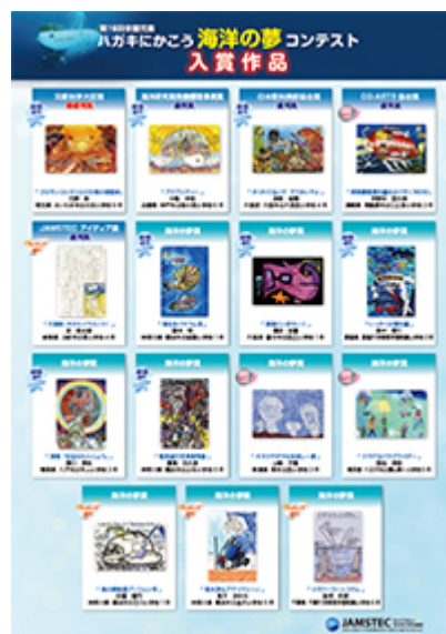
第16回 入賞作品 [PDF : 1.19MB]