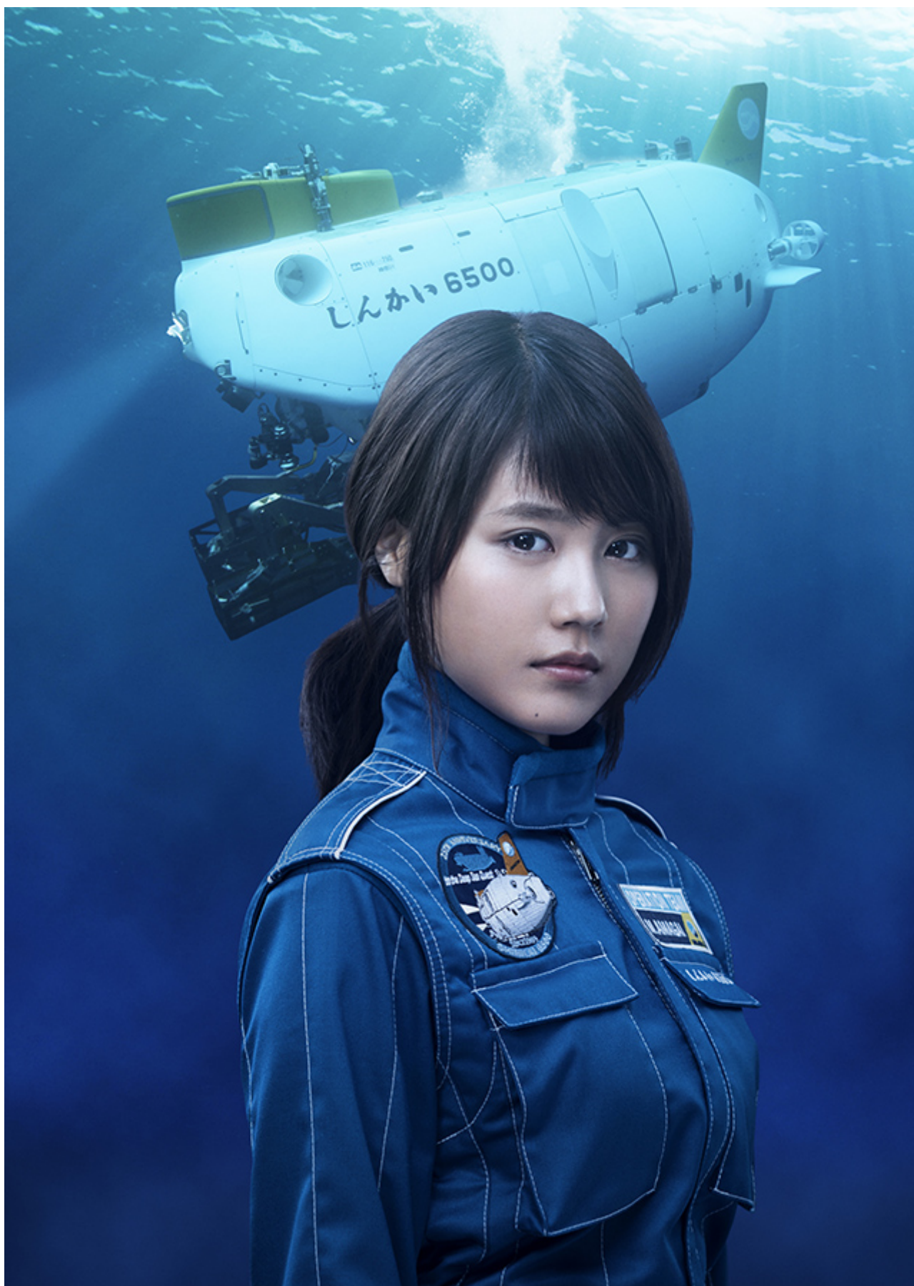
連続ドラマ初主演となる有村架純が「しんかい6500」女性パイロットを演じる