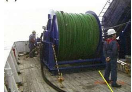
写真-3 ストリーマーケーブル