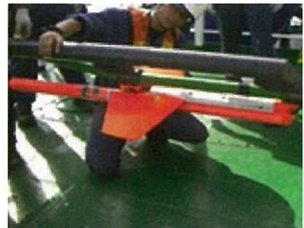
写真-4 Compass bird