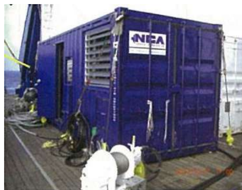
写真-1 エアガンコンプレッサー