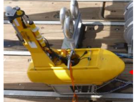
写真-5 GPS 付 Tail Buoy