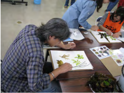
水洗いした海藻で押し葉標本を作ってみます。