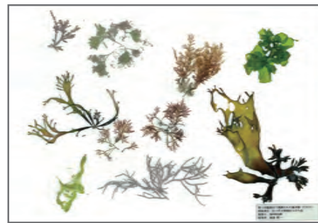
できあがった標本はこんな感じになります。(第1回沿岸観察会の作品)