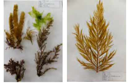
洗った海藻を紙にのせて乾くまで待ちます。