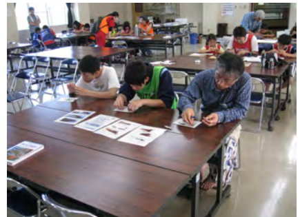
煮干し(カタクチイワシ)を手で解剖しました。魚のからだのつくりを楽しく学べます。解剖が終わった煮干しはおいしくいただきましたが、部位によって味が違うことがわかりました。