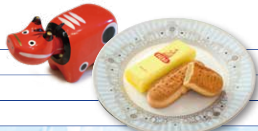
三万石のままだおる