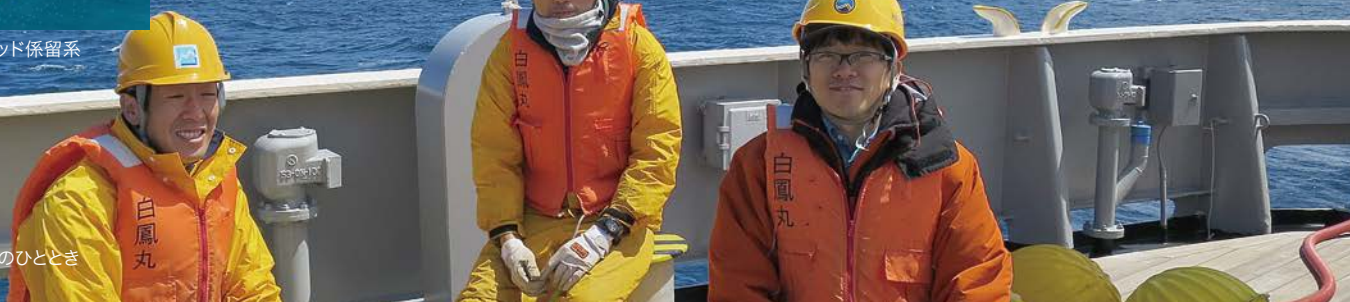
写真4 係留系作業後のひととき