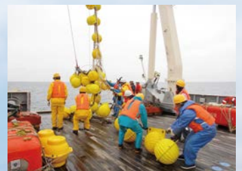
写真3 係留系の回収作業 (白鳳丸 KH-15-J01)