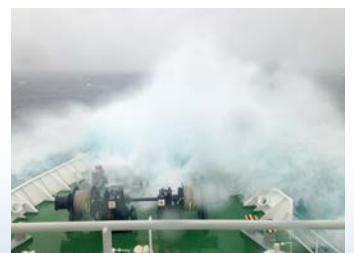
写真2 冬季の低気圧