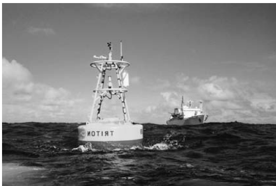
設置されたトライトンブイ

1997から1998年に発生した今世紀最大といわれたエル・ニーニョでは、1996年3月に、西太平洋で最大190mの深度に20℃の等温線が観察され、この海域に暖水が蓄えられました。そして、この等温線は、エル・ニーニョの発生にともない130mまで浅くなりましたが、この浅くなった部分の暖水は、東太平洋に運ばれ、それによりペルー沖では、20℃の等温線は、平均値よりも80mも深くなりました。このように、エル・ニーニョの前年に西太平洋に暖水が蓄えられることがエル・ニーニョの発生の一つの条件となっていることを示しています。